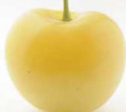
樱桃女王 The queen of cherries 樱桃女王 사쿠란보의 여왕