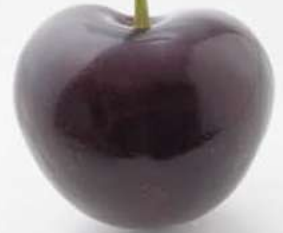
日本第一大粒 The largest of cherries in Japan 日本第一大粒 일본 제일의 큰열매