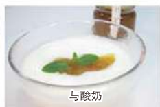
on yogurt 與酸奶 요구르트에 요거트에