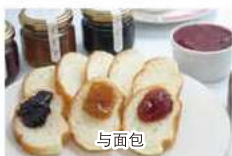
on bread 與麵包 빵에 빵에