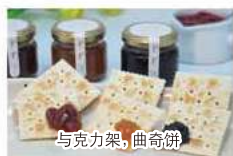
on crackers or cookies 與克力架, 曲奇餅 크래커 및 쿠키에 크래커나 쿠키에