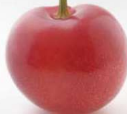
樱桃之王 The king of cherries 樱桃之王 사쿠란보의 왕