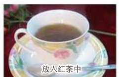
in your tea 放入紅茶中 홍차에 넣어서 紅茶に入れて