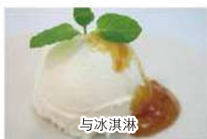
Over ice cream 與冰淇淋 아이스크림에 아이스

Delicious recipes for cherry jam. 櫻桃醬食譜 さくらんぼジャムのおいしいレシピ さ쿠란보 식초의 맛있는 레시피