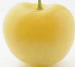
樱桃女王 The queen of cherries 樱桃女王 사쿠란보의 여왕