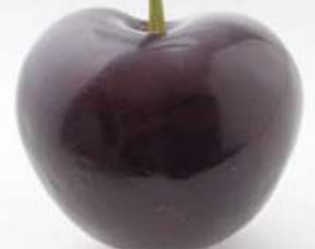
日本第一大粒 The largest of cherries in Japan 日本第一大粒 일본 제일의 큰열매

Generous amounts of our finest cherries are used to make this vinegar.