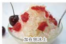
over shave ice 加在刨冰上 빙수에 뿌려서 加在刨冰上 かき氷にかけて