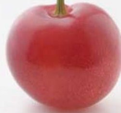
樱桃之王 The king of cherries 樱桃之王 사쿠란보의 왕